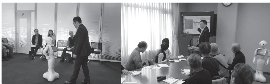
写真1 公開講座の様子（左：2016年10月27日実施、右：2017年11月10日実施）

「Pepper アプリ利用体験講座」では、実際にPepperを用いて、受講者にPepperアプリを体験してもらった。Pepperの操作の基本的な部分から始め、会話のやり取りの方法や、標準で搭載されているアプリの実行などを行った。また、「Pepper プログラミング開発体験講座」ではブロックプログラミングについて、code.orgのサイト等を用いて導入し、PepperプログラミングのためのブロックプログラミングであるChoregrapheを用いて、会話のやり取りを例にプログラミングを説明・実践した。写真1は公開講座の様子である。